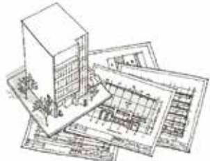
平面図・立面図・断面図／構造図／設備図